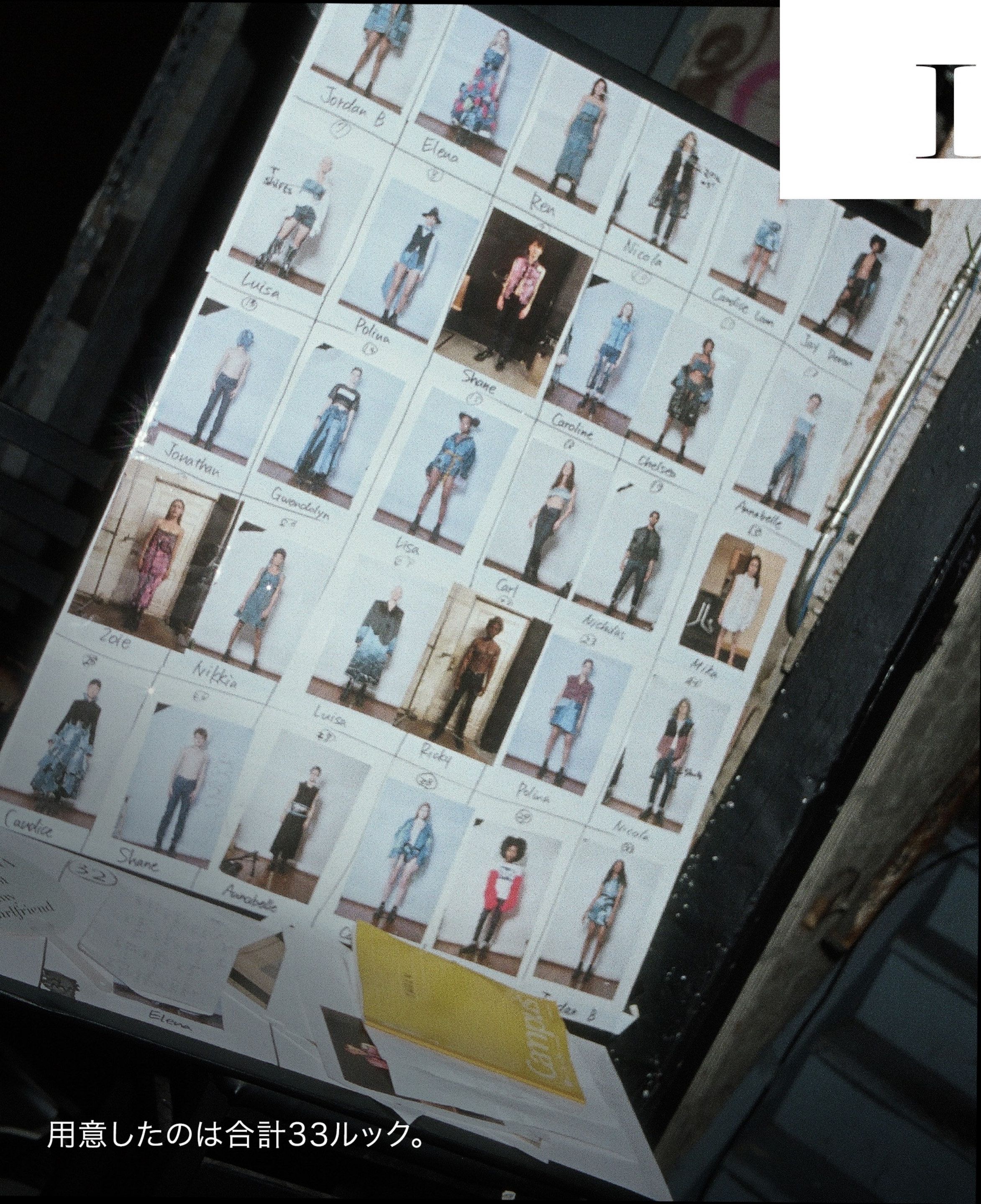
用意したのは合計33ルック。