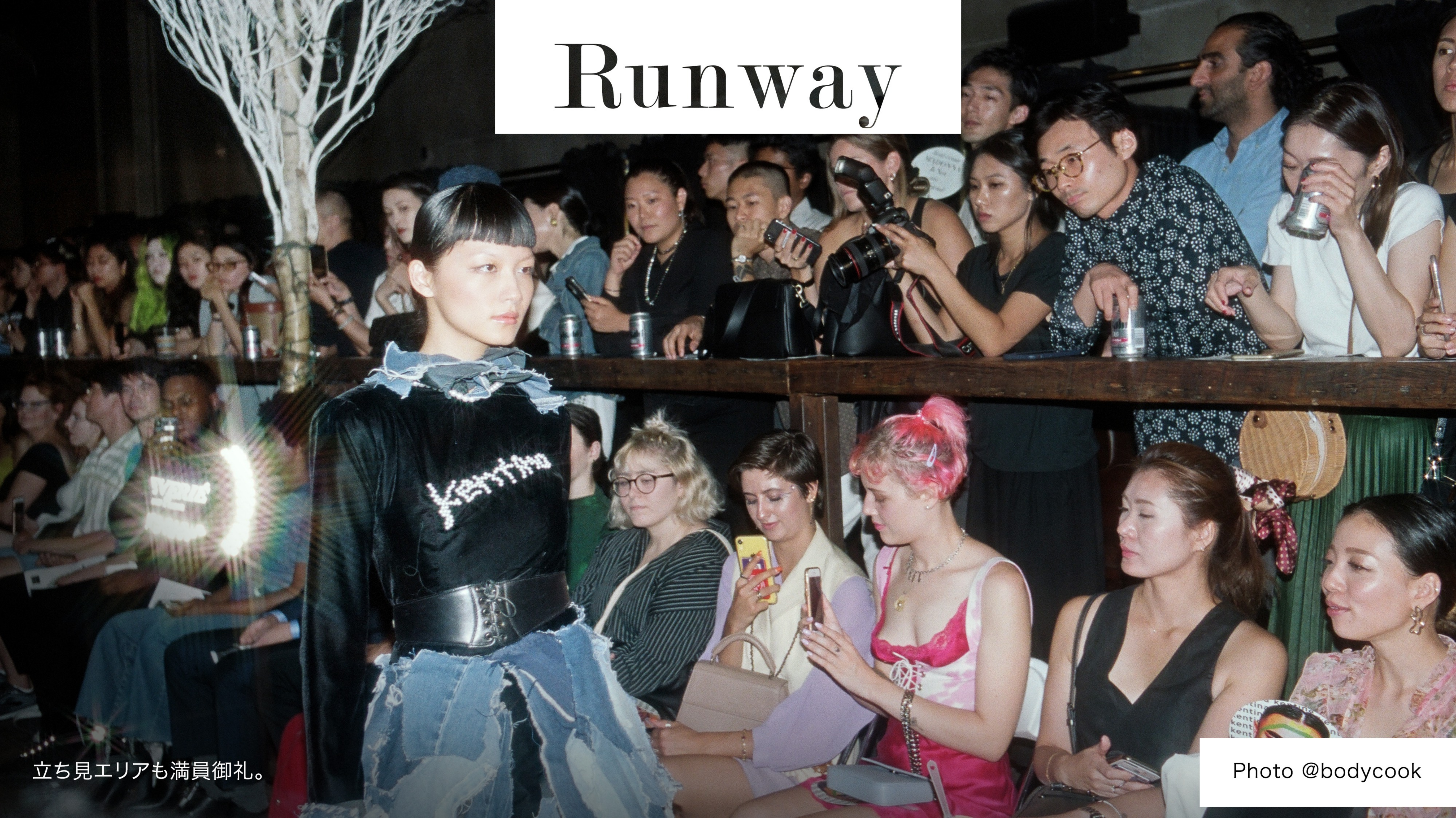
立ち見エリアも満員御礼。